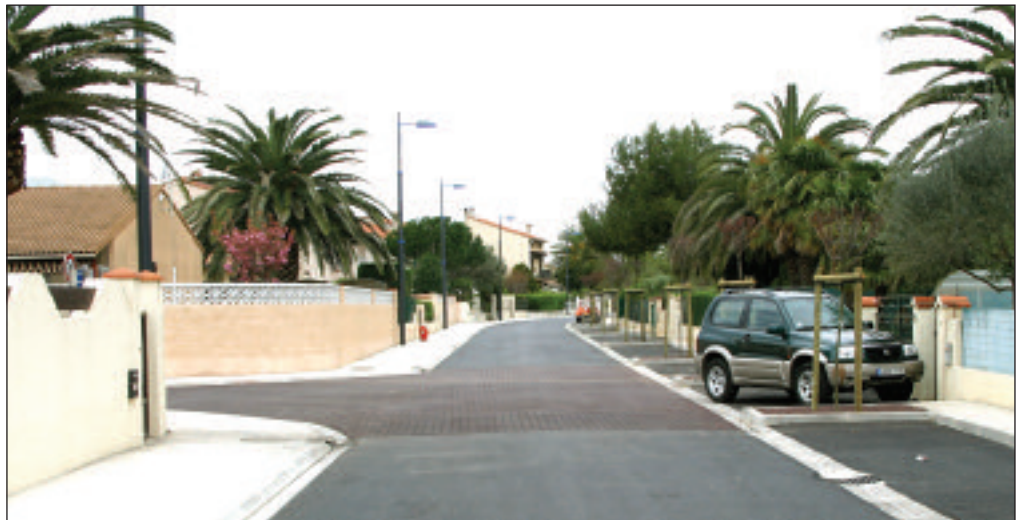
A l'image des travaux de la rue Alain, la ville consacrera 1,5 million d'Euros à la rénovation de la voirie en 2006.

"Nous respectons les orientations de l'audit financier réalisé en 2003 : la maîtrise des charges générales et des frais de personnel, ce qui nous permet d'augmenter notre capacité d'autofinancement et donc de limiter le recours à l'emprunt" a souligné Pierre Aylagas qui a également rappelé que "l'année 2005 avait permis à la commune d'accentuer son désendettement avec notamment des remboursements anticipés d'emprunts". Ce qui sera poursuivi en 2006 avec un montant d'emprunts inférieur à 2 millions d'Euros. Le budget primitif de fonctionnement 2006 s'élève à