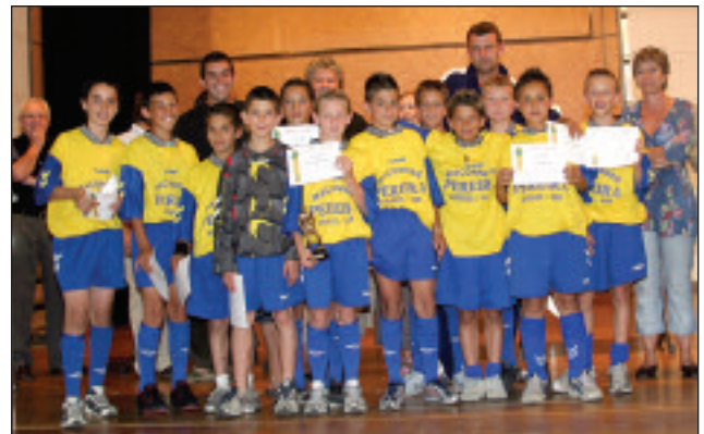
Les benjamins récompensés lors des Trophée des sports.

"Il arrivait par le passé que nous rencontrions des difficultés d'effectif, notamment au niveau des équipes de jeunes.