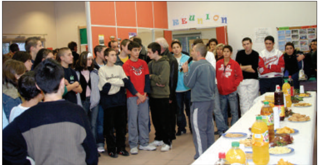
En 2005, une partie de la Dotation Urbaine a été affectée à l'aménagement de l'espace Jeunes qui accueille le Point d'information jeunesse et le service jeunesse de la Communauté de communes.

le conseil a approuvé le rapport sur l'utilisation de la dotation de solidarité urbaine versée par l'Etat. Cette dotation a permis de financer des politiques relevant de l'action et de l'insertion sociale, des activités extra-scolaires et de loisirs pour la jeunesse, l'aménagement de l'espace jeunes et des aides au développement économique. Ces actions représentent une dépense globale de 910 133 Euros pour laquelle la ville a