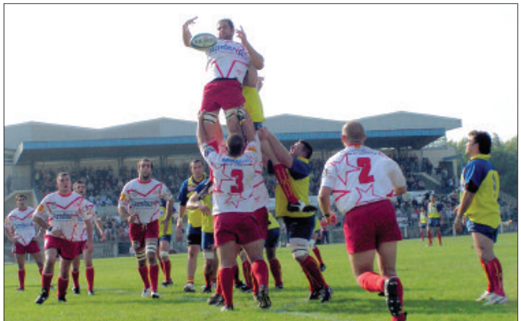
A l'image de cette touche, l'Etoile sportive catalane espère bien décoller dans les play-off.

En terminant à la troisième place de sa poule lors de la phase préliminaire, l'Etoile Sportive Catalane a décroché son billet pour les play-off de fédérale 1. Avec 33 points marqués (9 victoires, 1 nul et 4 défaites), les Argelésiens terminent derrière Aurillac et Nîmes. On s'aperçoit, en consultant le classement des 6 poules de Fédérale 1, que les Etoilistes avec 33 points terminent à la sixième place nationale de ce championnat, devant des équipes classées à la première ou la deuxième place de leur poule. Pour sa seconde année à ce niveau, l'ESC rejoint ainsi le cercle très fermé des 24 meilleures équipes amateurs qualifiées pour disputer le challenge Jean