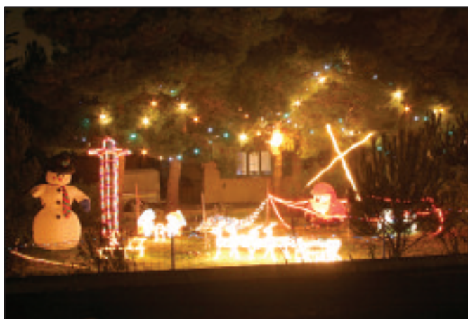
Premier prix de la catégorie commerces.

Catégorie villas : René Paillisse (route de Notre-Dame-de-Vie).