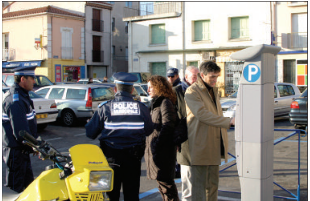
A partir du 26 février, à l'image de la place Gambetta, le stationnement Route Nationale sera en zone bleue gratuite.

Cette opération se complétait par la création de 2 parkings