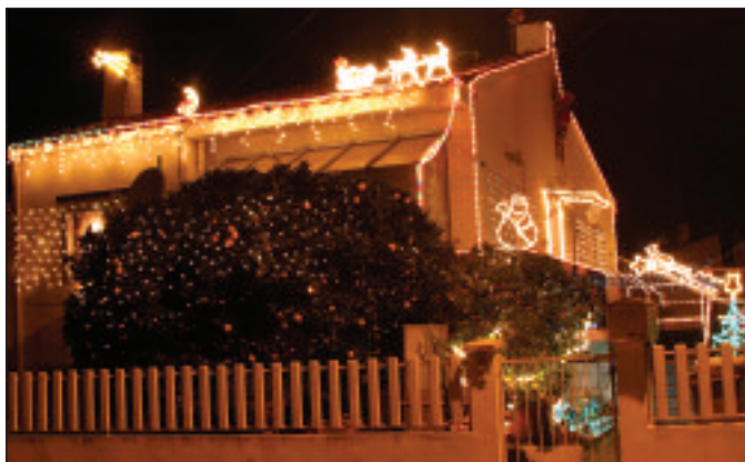
Premier prix de la catégorie villas.