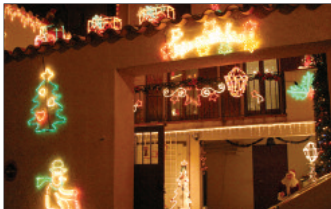
Premier prix de la catégorie appartements.

T rès attendu, le palmarès du concours de façades a été livré à l'occasion des vœux du conseil municipal à la population. D'une année à l'autre, le nombre de participants est resté stable. Le jury a eu une tâche bien difficile pour départager les 39 inscrits. Voici le palmarès.