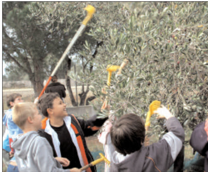
Travaux pratiques dans les oliveraies pour les écoliers d'Argelès-sur-Mer

L'olivier de Saint Julien assure également la promotion de cet arbre dans les écoles du départe-