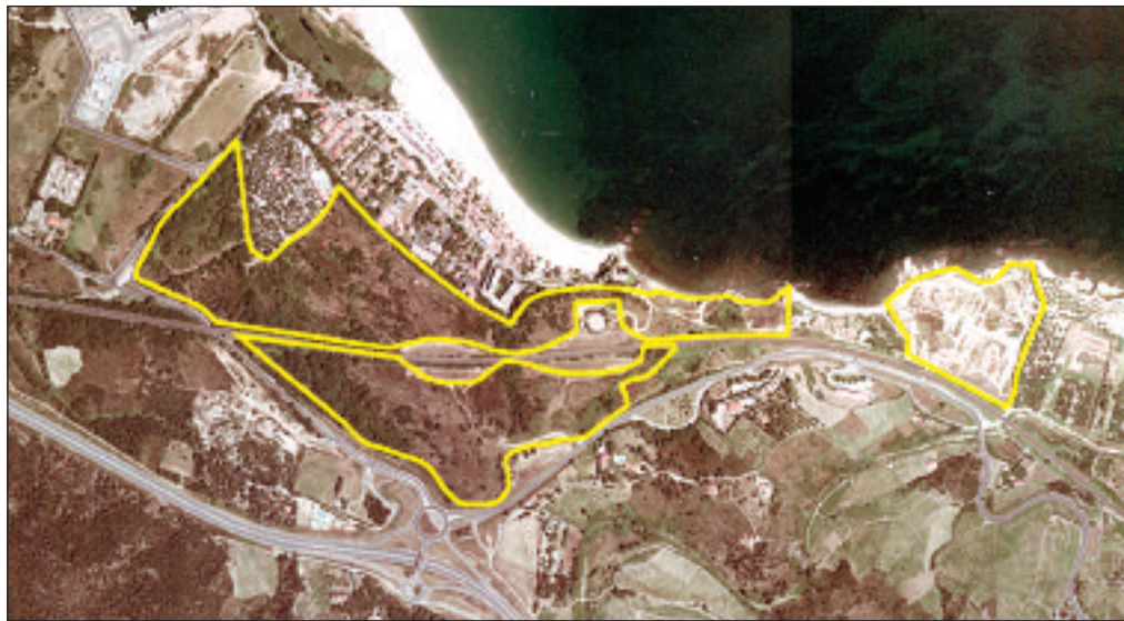
Le site naturel de la Torre d'en Sorra et des rochers des Criques de Porteils délimité par le plan ci-dessus sera géré par la ville.

L'assemblée a demandé au préfet de "poursuivre la concertation afin de produire un zonage raisonnable ainsi qu'un règlement applicable et juste". Si tous les intervenants ont souligné la nécessité de doter Argelès-sur-Mer d'un PPRI, ils ont mis en