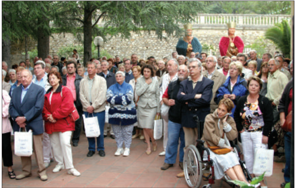
Plus de 300 personnes assistaient à cette réception pour l'accueil des nouveaux Argelésiens.

S'installer dans une ville, c'est un peu découvrir un nouveau monde. Il y a des marques à trouver et des repères à prendre. Alors, chaque année, la ville organise à l'intention des nouveaux arrivants une réception à l'espace Jules Pams à Valmy en présence du maire, entouré des adjoints et du conseil municipal. C'est l'occasion pour les néo-Argelésiens d'engranger un maximum d'information. D'abord auprès des services municipaux ; ensuite auprès des associations qui leur permettront de participer à la vie locale ;