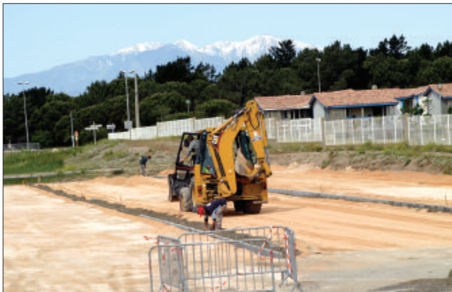
Les travaux d'aménagement de l'aire d'accueil de stationnement des camping-cars située plage nord dans la dépression du Tamariguer. Une autre est en cours de réalisation à Port-Sud.

Une aire de service municipale située à l'espace de Loisirs, plage Nord, permet la fourniture d'eau et d'électricité ainsi que la vidange. Des aires de services privées sont disponibles aux Criques de Porteils, aux