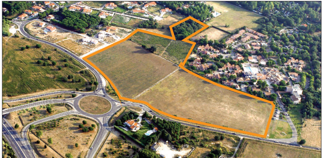
Vue aérienne du site du futur lotissement communal à Taxo.

Elle sera suivie par la consultation des entreprises pour les travaux de viabilisation et la