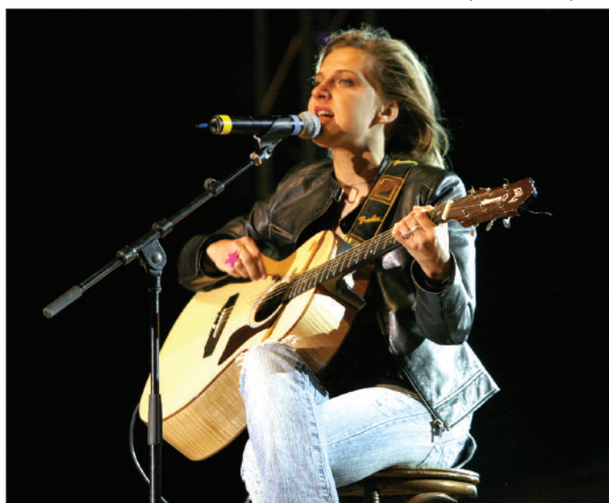
Le concert gratuit de la Nouvelle Star, le 15 août, a rassemblé 25 000 spectateurs

Voilà un bilan non exhaustif des animations de l'été 2008, animations indissociables d'Argelès-sur-Mer et qui concourent à bonne fréquentation touristique de la commune.