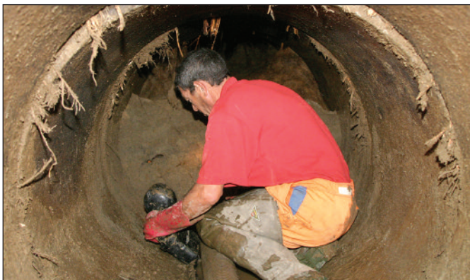
Travaux de curage de la prise d'eau du Tech.

Une délibération en ce sens sera proposée aux élus lors du prochain conseil municipal d'octobre. Nous aurons l'occasion d'en reparler.