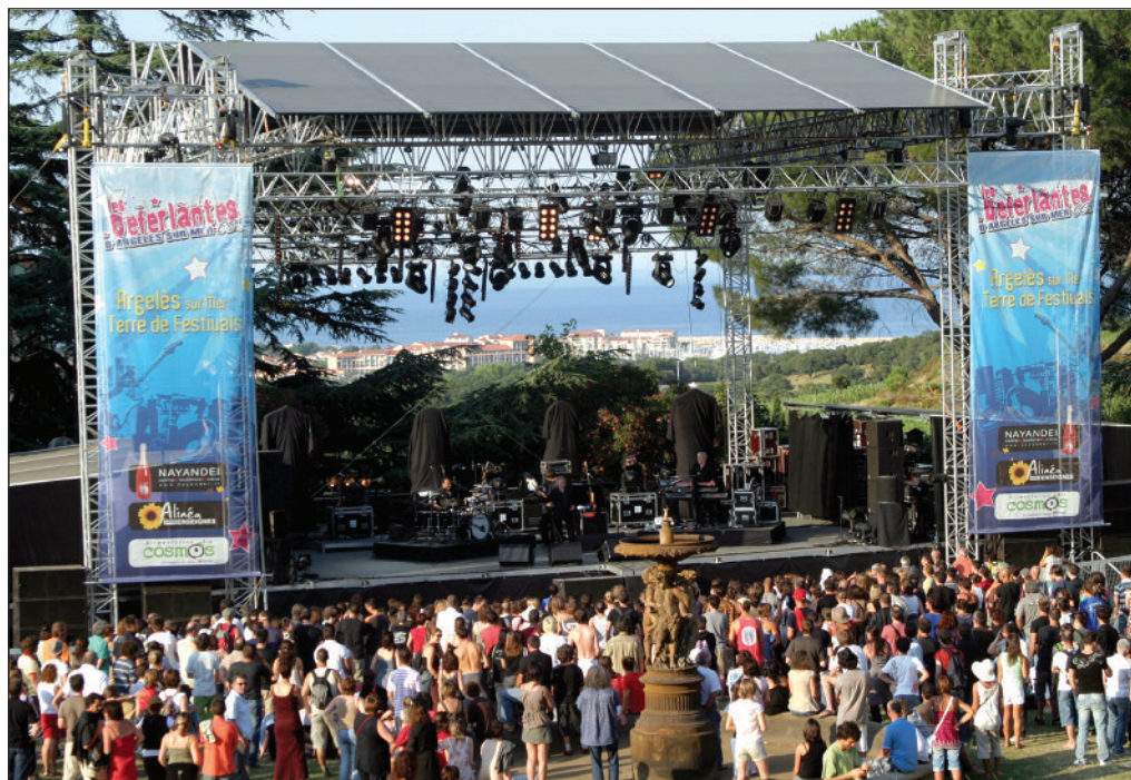
Le parc de Valmy : au premier plan la scène ; en arrière-plan la Méditerranée. Un site unique.

Le rendez-vous gourmand du dimanche en fin d'après-midi est