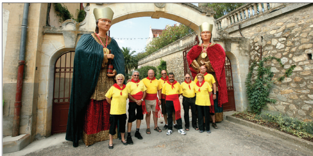
L'équipe de la Colla Gegantera rassemblée à Valmy

C'est aussi la possibilité de mieux connaître les origines des Gegants dont certains remontent