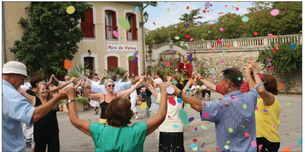
Avant le cinquantenaire, répétition à Valmy lors de l'Aplec.

Cela fait cette année 50 ans que le Foment de la sardane se mobilise pour faire vivre la sardane. Des grands rassemblements sardanistes des années 60 et 70 à la création de l'Aplec de Valmy en 1975 en passant par la création du groupe folklorique Ginesta Florida, le Foment a marqué l'histoire d'Argelès-sur-Mer. Les 3 jours de fête à l'occa-