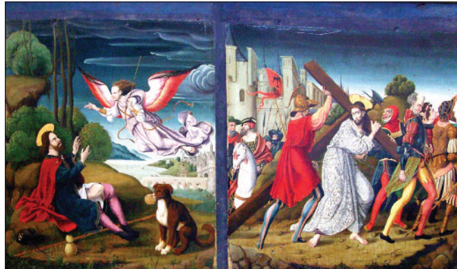
La restauration du fragment de prédelle de Saint-Roch et l'ange guérisseur a dévoilé une oeuvre magnifique à re-découvrir.

La première est une statue en bois polychrome de Marie-Madeleine datant de la fin du 17 e ou du début du 18 e . Le traitement effectué a permis de redonner tout son éclat