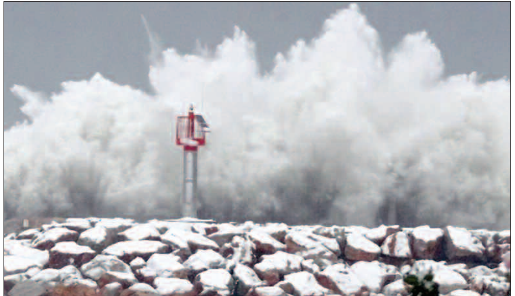
Le chenal de Port-Argelès sous la tempête le 26 décembre

Dans le port, les fixations du ponton à la terre ont été rom-