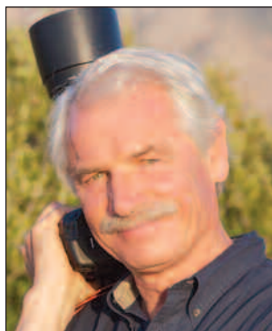
Yann Artus-Bertrand

L’opération les “Enfants de la Mer” est parrainée par Gérard Onesta, vice-président du parlement européen, Yann Arthus-Bertrand et Maud Fontenoy. Yann Arthus-Bertrand est un photographe reconnu internationalement pour son combat en faveur de la sauvegarde de la planète. En 1991, il crée l’agence