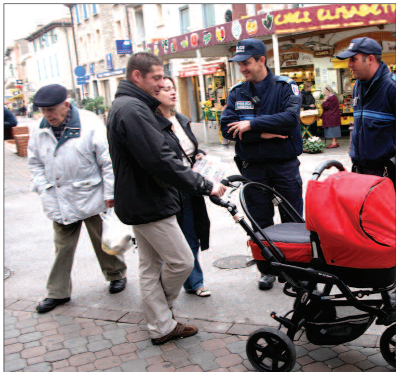
Patrouille de la police municipale au centre village : l'îlotage a été renforcé depuis le début de l'année.

"Les premiers retours que nous percevons sont positifs. Au centre village, ce sont les mêmes agents qui patrouillent le matin et l'après-midi. Cela facilite le contact et la prise d'information"