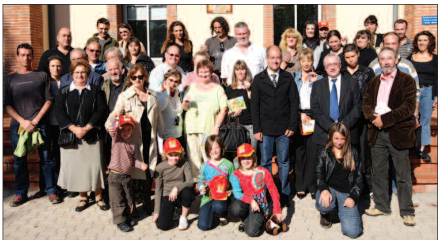
Photo de famille dans la cour de l'hôtel de ville pour les nouveaux locataires.

Pour ce programme de 64 logements -12 pavillons et 52 logements-, la ville a offert le terrain (336 400 euros) à l'Office et réalisé