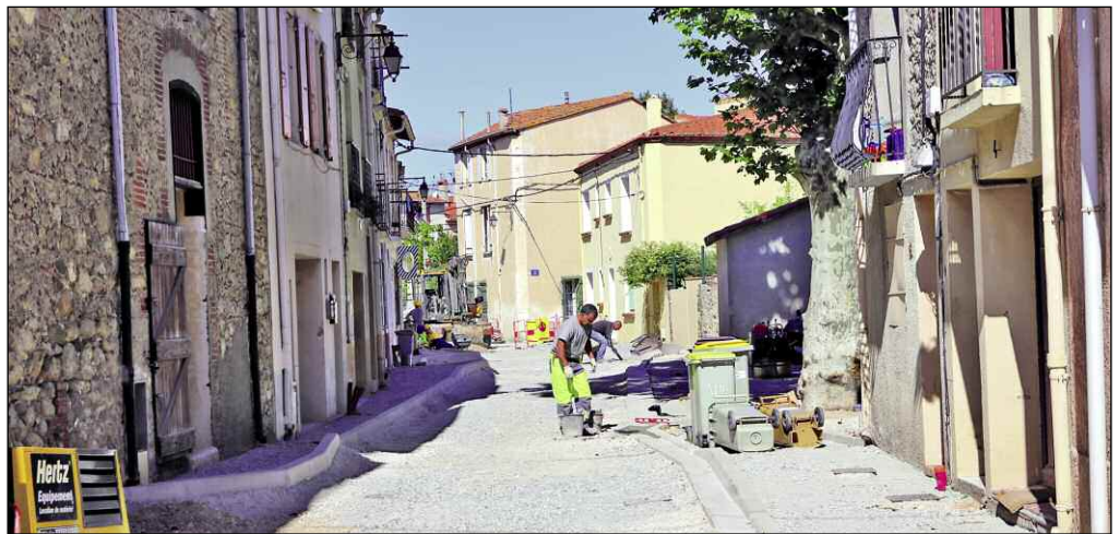
La Ville investit chaque année des sommes considérables dans la voirie. Exemple : la rue Joffre

Pierre Aylagas profite de ce point pour revenir sur l'ensemble des travaux réalisés dans la Ville. « La municipalité accorde une grande importance à la voirie. Cette année, elle va investir 4 millions d'euros dans ce domaine. Ces travaux concernent autant le village que la plage et les écarts. Dès que