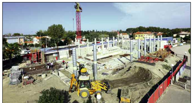
Construction de la piscine communautaire