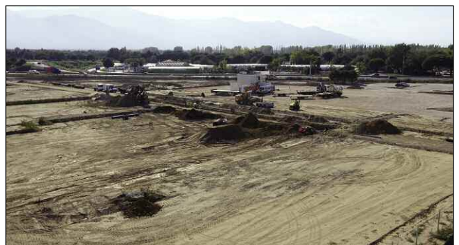
Construction du lycée polyvalent Emile Combes