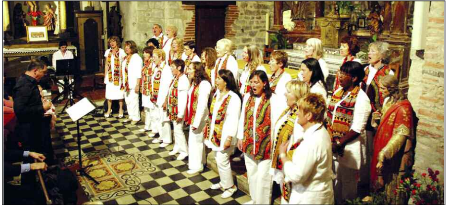
La ville soutient les associations qui s'investissent dans la vie locale

Les autres associations (culturelles, patrimoniales, etc.) ne sont pas oubliées. La ville privilégie celles qui s'investissent dans la vie locale, notamment en organisant des manifestations d'envergure, à l'exemple d'ARG et son Salon