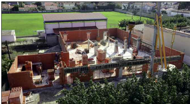
Construction du restaurant scolaire Curie-Pasteur