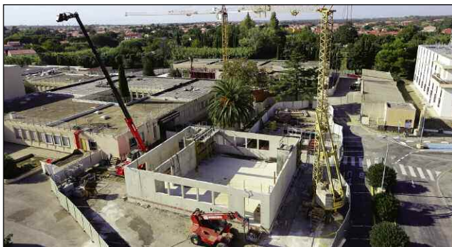
Réhabilitation du collège des Albères