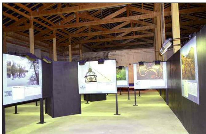
Jusqu'au 2 novembre, site de Paulilles (Port-Vendres) : La Marenda d'aquí