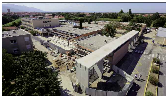
La réhabilitation du collège des Albères (maîtrise d'ouvrage : conseil général)