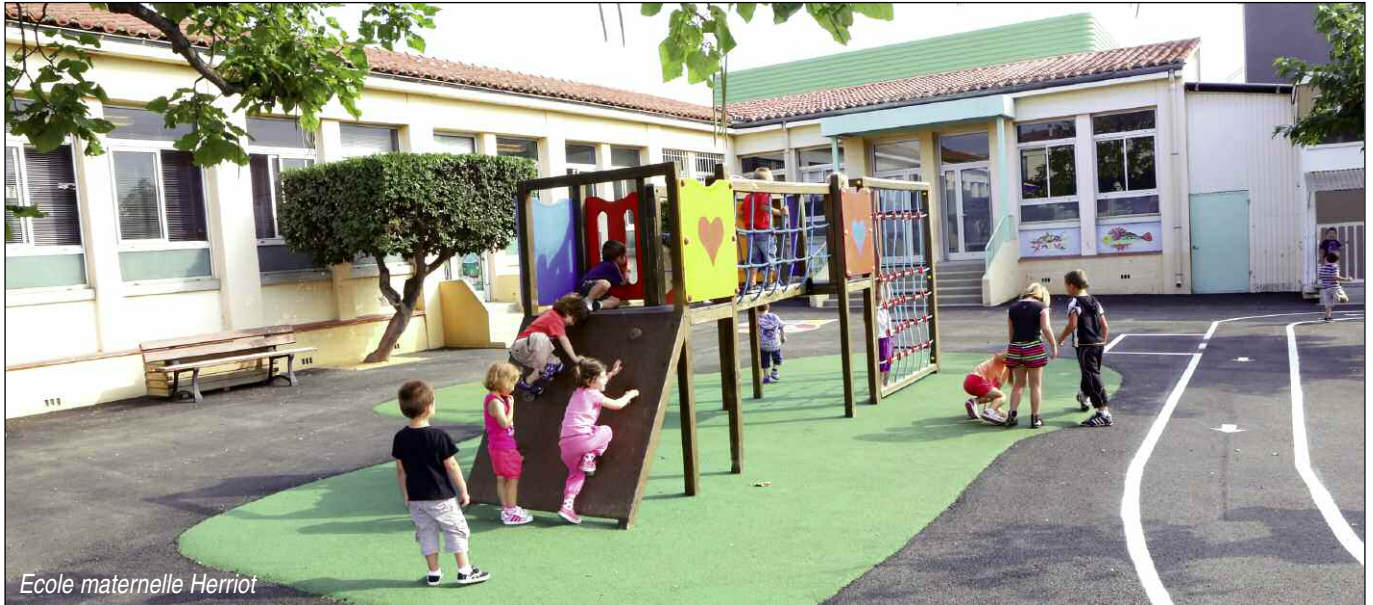
Ecole maternelle Herriot

1 474 collégiens et écoliers argelésiens ont effectué leur rentrée. Nouveauté de cette rentrée : l'application des nouveaux rythmes scolaires dans les établissements de maternelle et du primaire. Le point sur cette reprise.