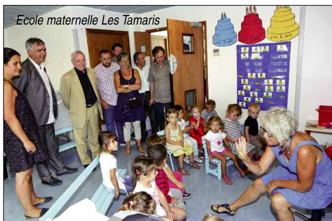
Ecole maternelle Les Tamaris