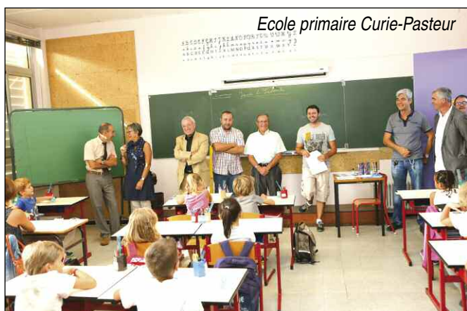
Ecole primaire Curie-Pasteur