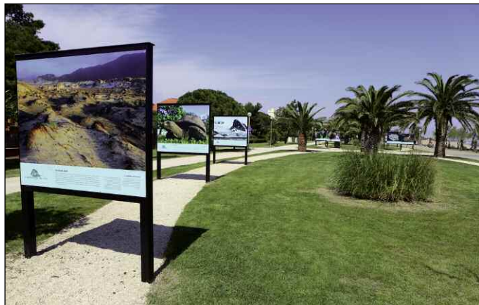
Jusqu'au 30 septembre, promenade du front de mer (Argelès-Plage) : D'îles en îles et Pas bêtes les bêtes

Pas moins de cinq expositions d'Enfants de la mer sont visibles - gratuitement - sur la côte catalane. L'occasion d'enrichir sensiblement vos connaissances en matière de préservation de l'environnement.