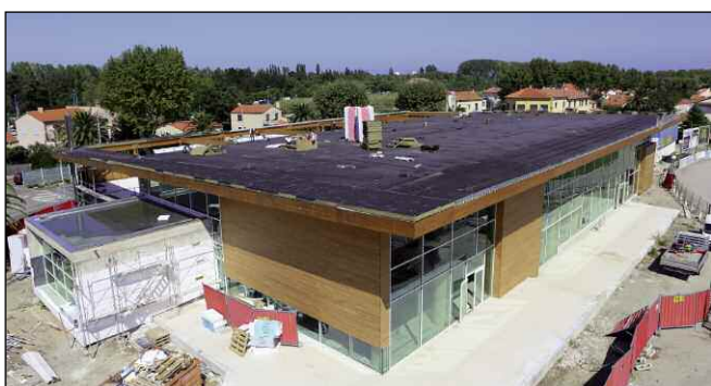
Les travaux de la piscine communautaire (maîtrise d'ouvrage : communauté de communes)