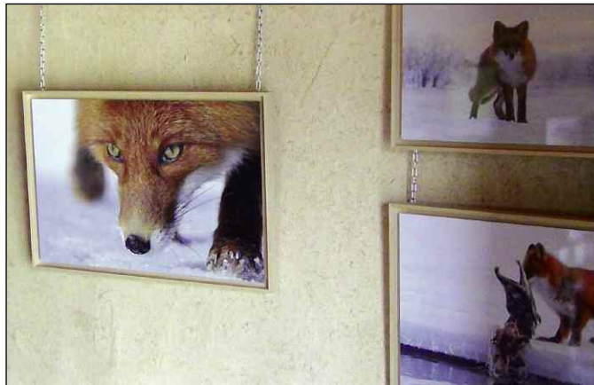
Jusqu'au 30 septembre, village des Enfants de la mer (Argelès-Plage) : Le renard roux