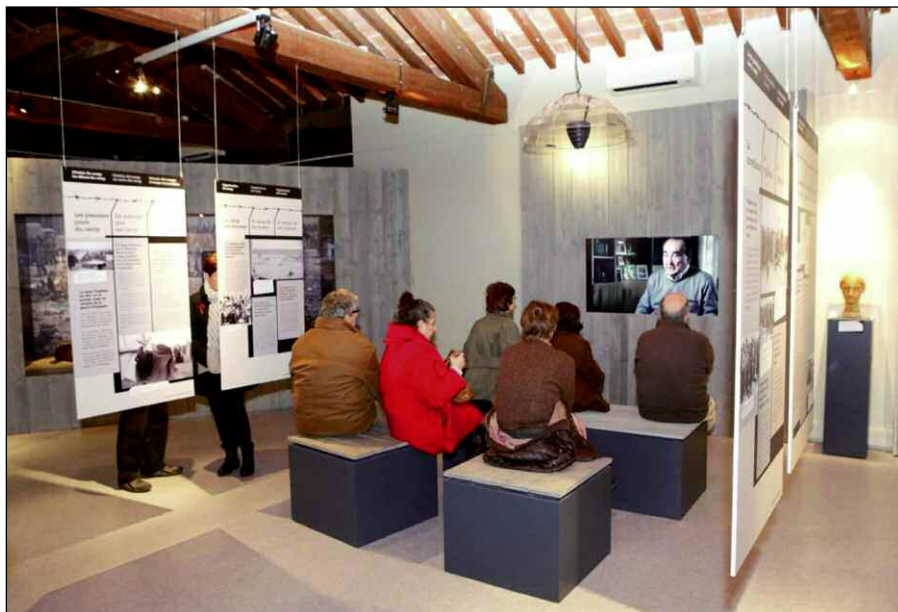
Le Mémorial du camp fait partie des actions initiées par Argelès-sur-Mer avec le soutien du MUME

Courant juillet 2014, le MUME a organisé un séminaire international d'été sur le thème : Mémoire et témoignage au XXIe siècle. La frontière de la mémoire. La mémoire de la frontière. Une convention de partenariat entre les deux villes dans le cadre de la