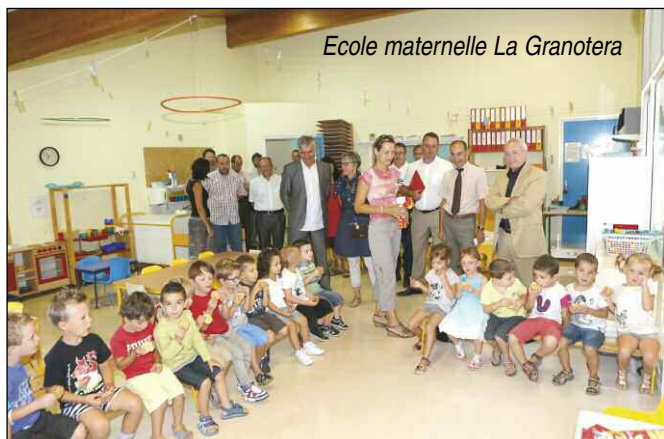
Ecole maternelle La Granotera