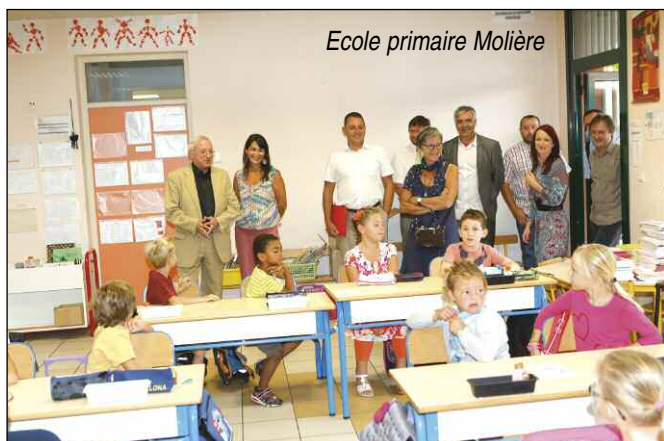
Ecole primaire Molière