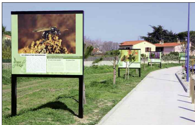
Toute l'année, parking de la Tolérance et devant l'école Curie-Pasteur (Argelès-Ville) : El bosc d'aquí