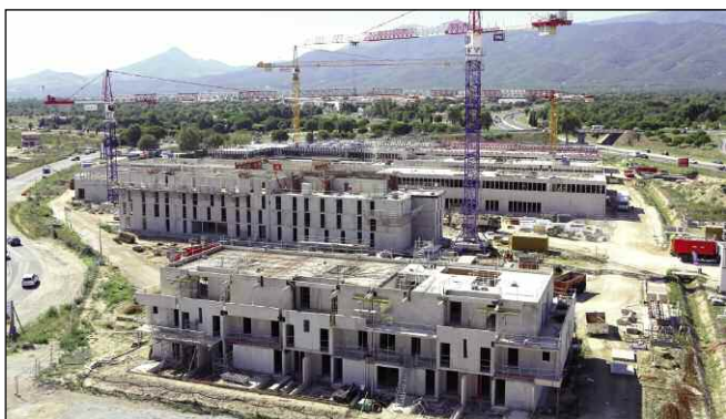
La construction du lycée Emile Combes (maîtrise d'ouvrage : conseil régional)