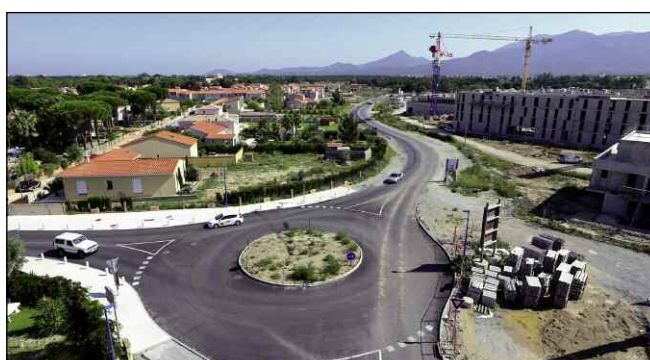
Dernière tranche de l'opération Taxo entre campings des Cèdres et le Pearl ; avenue Nelson Mandela devant le lycée