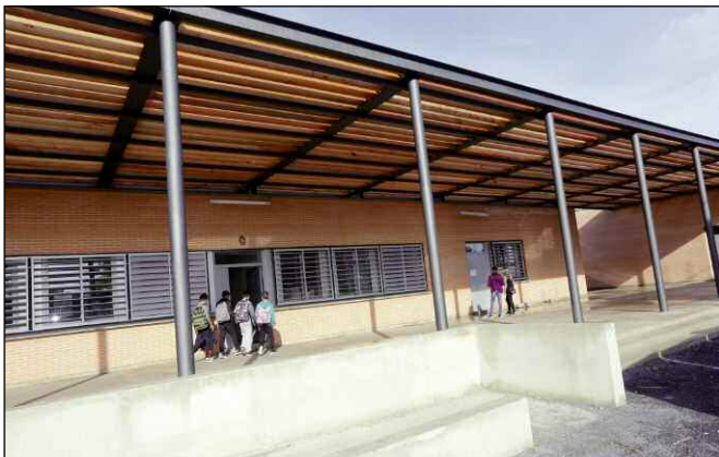
Réhabilitation du collège des Albères (maîtrise d'ouvrage : conseil général)