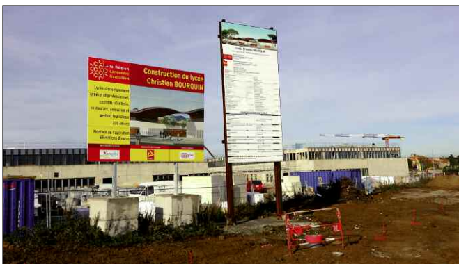
Construction du lycée Christian-Bourquin (maîtrise d'ouvrage : conseil régional)