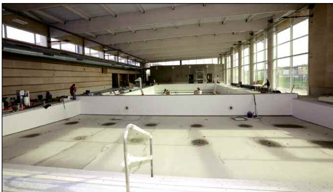
Aménagement de la piscine communautaire (maîtrise d'ouvrage : communauté de communes)

En savoir plus sur les axes concernés : 04 68 95 34 23