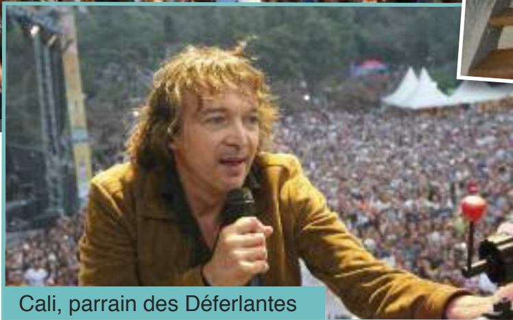
Cali, parrain des Déferlantes