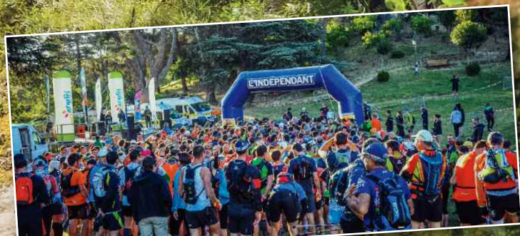
Départ de la course Argelès Nature Trail