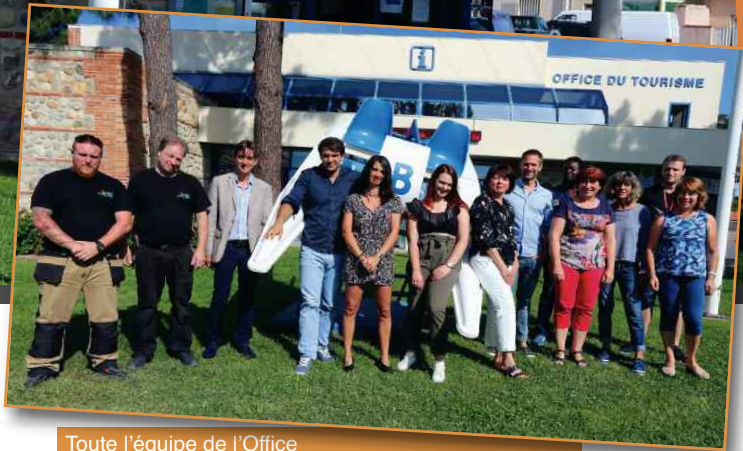
Toute l'équipe de l'Office

Le travail collectif avec son équipe, les élus et tous les acteurs du tourisme s'impose comme une évidence. On sent sincèrement le nouveau directeur séduit par une ville qu'il ne compte pas quitter de sitôt. « Je me suis construit une expérience en ayant la volonté de prendre la direction d'un Office de tourisme d'une destination d'envergure. J'ai découvert à Argelès-sur-Mer un environnement dynamique dans toutes les possibilités offertes aux vacanciers. C'est passionnant : la destination possède de multiples perspectives de développement ! »