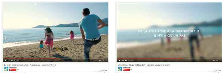
Campagne promotionnelle en vidéo sur les réseaux

Multitude de métiers, adaptation et questionnement permanent : la routine n'est pas au programme de l'Office de tourisme.